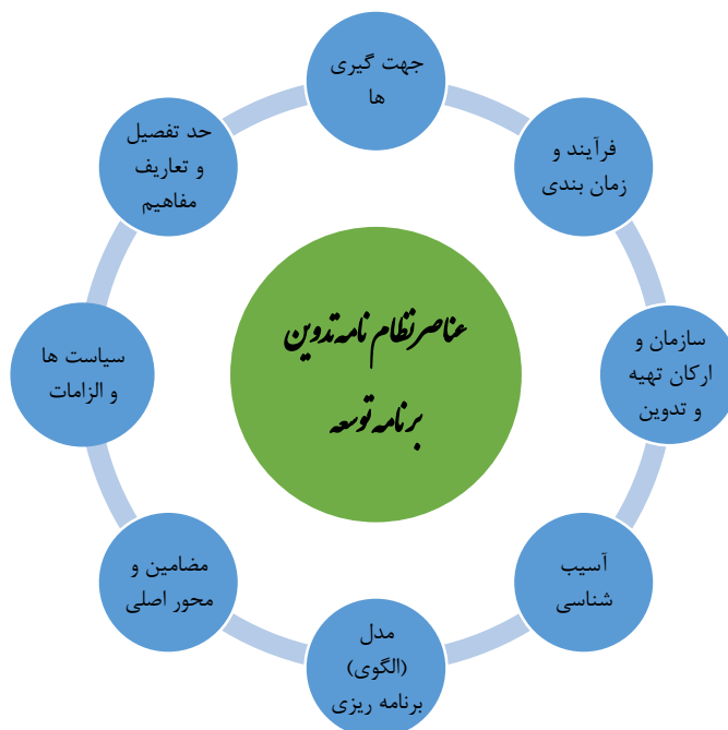
شکل ۱: عناصر نهایی نظام‌نامه تدوین برنامه توسعه

مرحله آخر؛ احصا نهایی و ارائه پیشنهاد عناصر برای تدوین برنامه هفتم توسعه است. در این قسمت با استفاده از نظرات کارشناسان (پنل نخبگانی) و با عنایت به فراوانی مواردی که در نظام‌نامه‌های برنامه گذشته بدان‌ها تاکید شده است؛ عناصر، گزینش نهایی شده و به عنوان درون‌مایه و سازمان اصلی نظام‌نامه تدوین برنامه هفتم توسعه پیشنهاد شده است (شکل ۱).