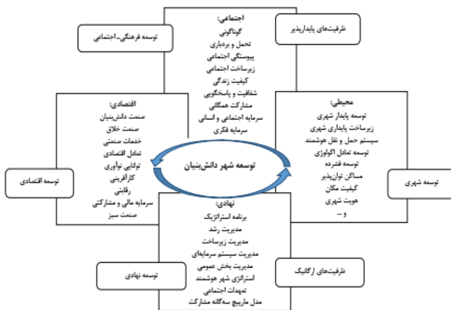
شکل ۱: عناصر مدل توسعه شهر دانش‌بنیان از نظر «بیگیت کانلار»

معتقدند که رسیدن به شهرهای دانش‌بنیان از طریق اجرا و دستیابی به سطح بالایی از فناوری؛ بهبود خدمات و آموزش شهروندان از طریق ایجاد ارتباطات و تقویت سرمایه انسانی محقق می‌شود. رشد شهرنشینی تا سال ۲۰۵۰ حدود ۷۰ درصد از جمعیت جهان خواهد بود (عابدینی و دیگران، ۱۳۹۹) و بنابراین شهرها با محدودیت منابع مواجه شده و این مسئله، شرایط و کیفیت زندگی افراد را با مشکلاتی همراه خواهد کرد؛ بنابراین، ارائه شرایط زندگی باکیفیت بالا و مدیریت منابع شهری کارآمد، به وظیفه‌ای حساس و چالش‌برانگیز برای شهرها تبدیل خواهد شد. در چنین شرایطی تفکر نسبت به تبدیل شهرهای کنونی به شهرهای دانش‌بنیان لازم و ضروری به نظر می‌رسد (Yigitcanlar, 2014). «بیگیت کانلار» در تلاش برای معرفی چشم‌انداز جهانی مدل توسعه شهر دانش‌بنیان، مؤلفه‌های اصلی و عناصر سازنده این مدل از توسعه را به شکل زیر ترسیم کرده است: